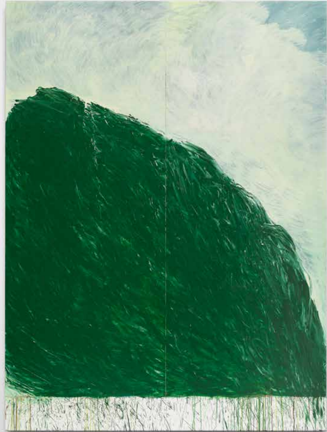
Green Painting II , 2021-22, óleo sobre tabla, 265,5 x 200 cm