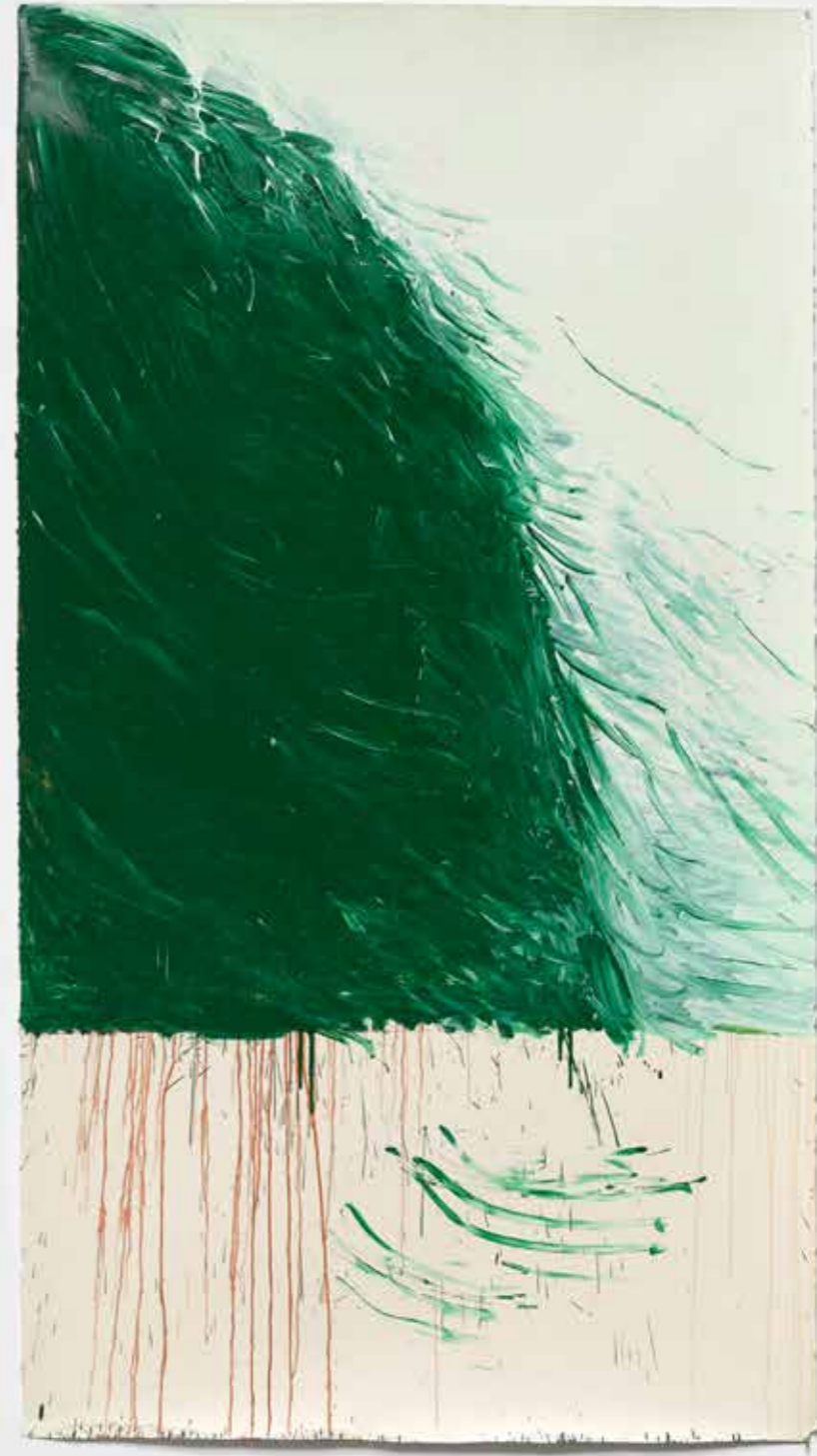
Green Painting IV , 2021-22, óleo sobre papel, 227 x 124 cm