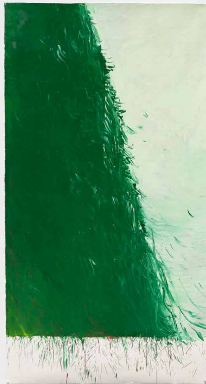
Green Painting VI , 2021-22, óleo sobre papel, 231 x 124 cm