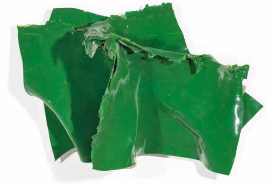
ANGE N° 13 (VERT) , 2019, acrílico sobre lienzo, 50 x 78 x 27 cm