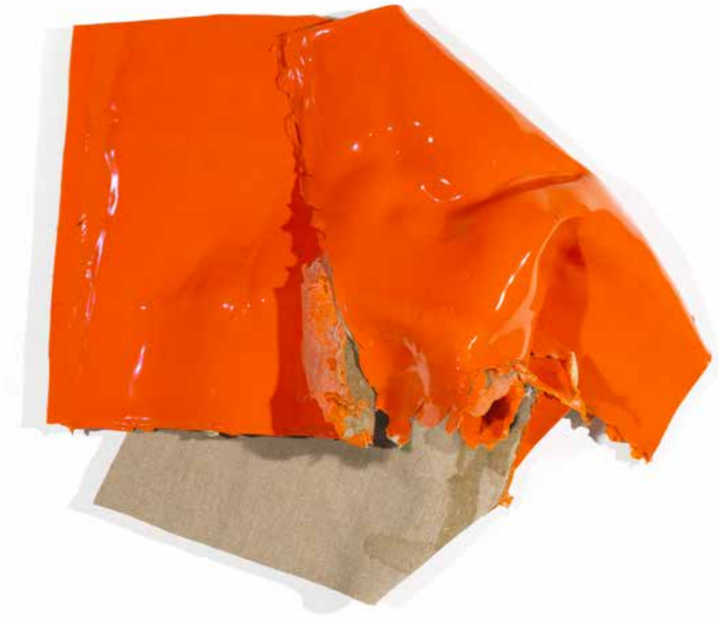
ANGE N° 21 (ORANGE) , 2019, acrílico sobre lienzo, 75 x 80 x 23 cm