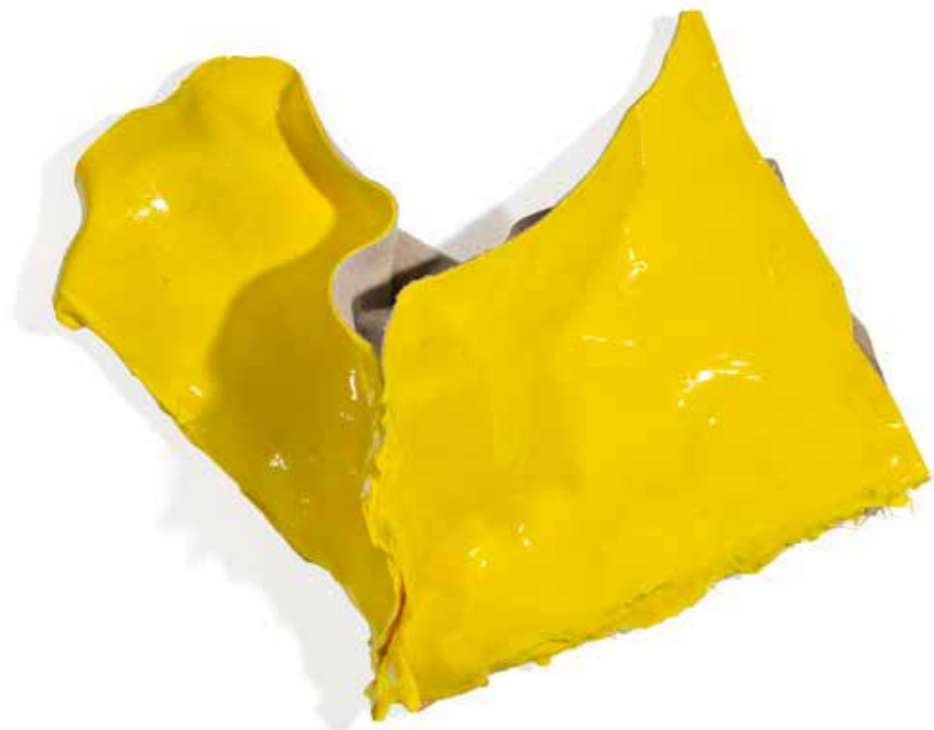
ANGE N° 20 (JAUNE) , 2019, acrílico sobre lienzo, 60 x 75 x 30 cm