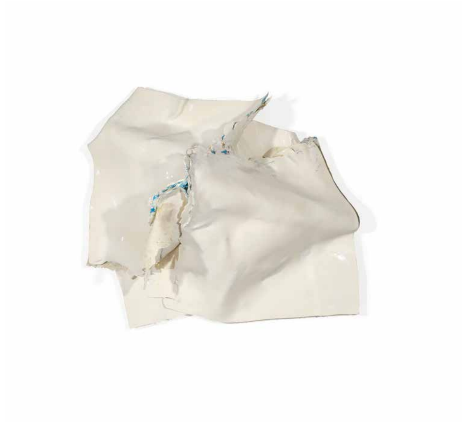
ANGE N° 27 (BLANC) , 2019, acrílico sobre lienzo, 75 x 80 x 40 cm