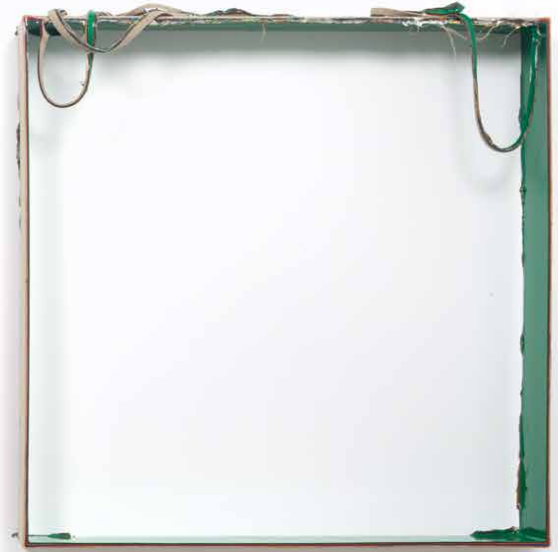
COLOR IS LUST (GREEN) , 2018 - 2019, acrílico sobre lienzo y acero, 116 x 116 x 17 cm