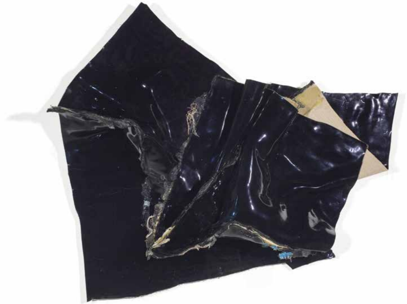
ANGE N° 23 (NOIR), 2019, acrílico sobre lienzo, 110 x 125 x 25 cm