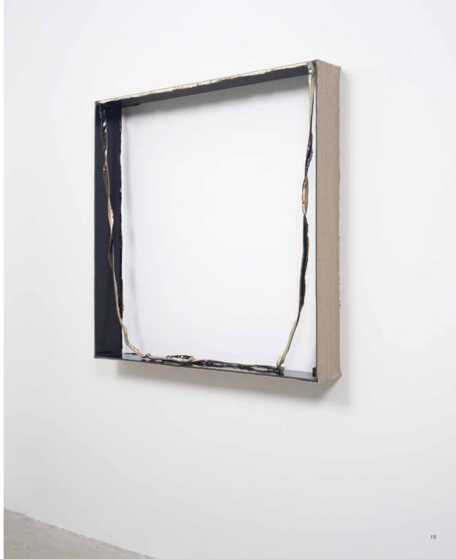
COLOR IS LUST (BLACK) , 2018 - 2019, acrílico sobre lienzo y acero, 116 x 116 x 17 cm