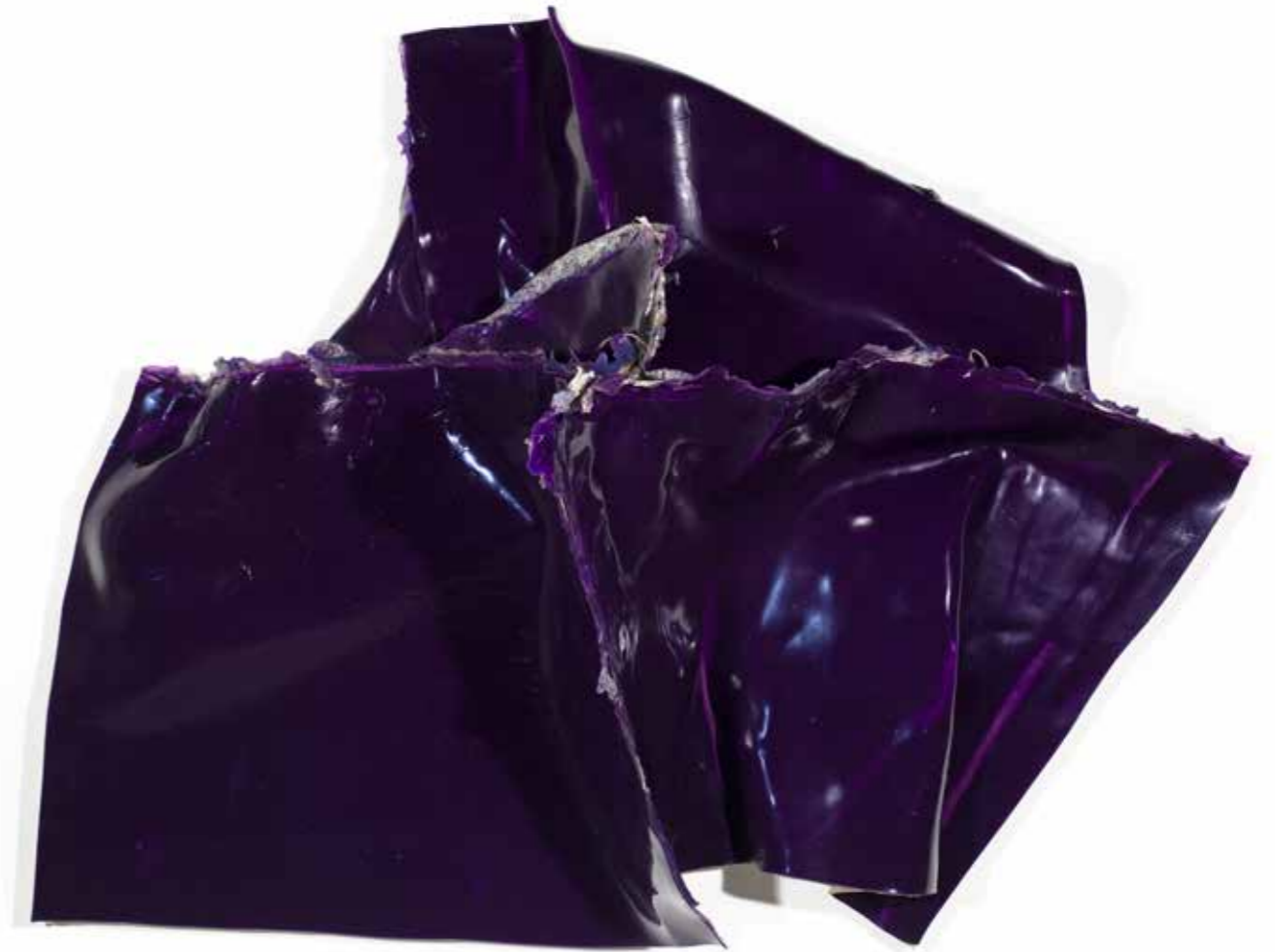
ANGE N° 24 (VIOLET) , 2019, acrílico sobre lienzo, 120 x 155 x 40 cm