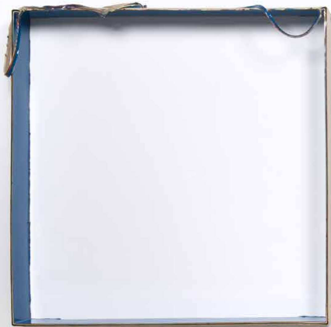
COLOR IS LUST (BLUE) , 2018 - 2019, acrílico sobre lienzo y acero, 116 x 116 x 17 cm