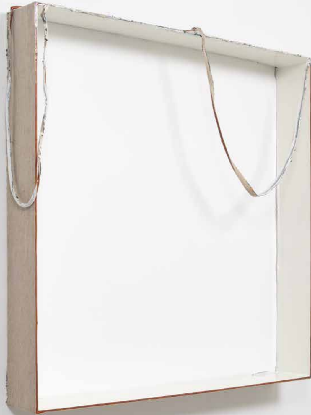
COLOR IS LUST (WHITE) , 2018 – 2019, acrílico sobre lienzo y acero, 116 x 116 x 17 cm