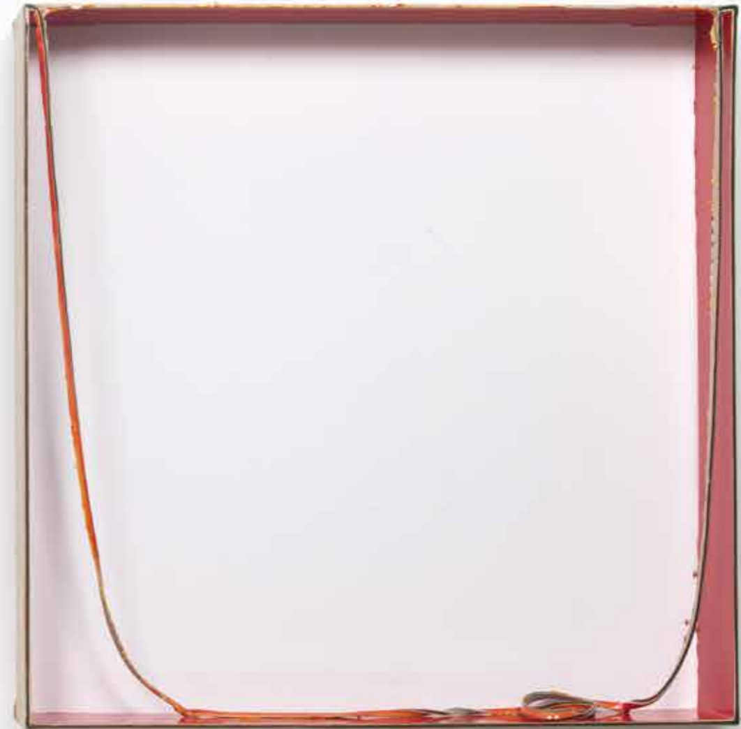
COLOR IS LUST (RED) , 2018 - 2019, acrílico sobre lienzo y acero, 116 x 116 x 17 cm