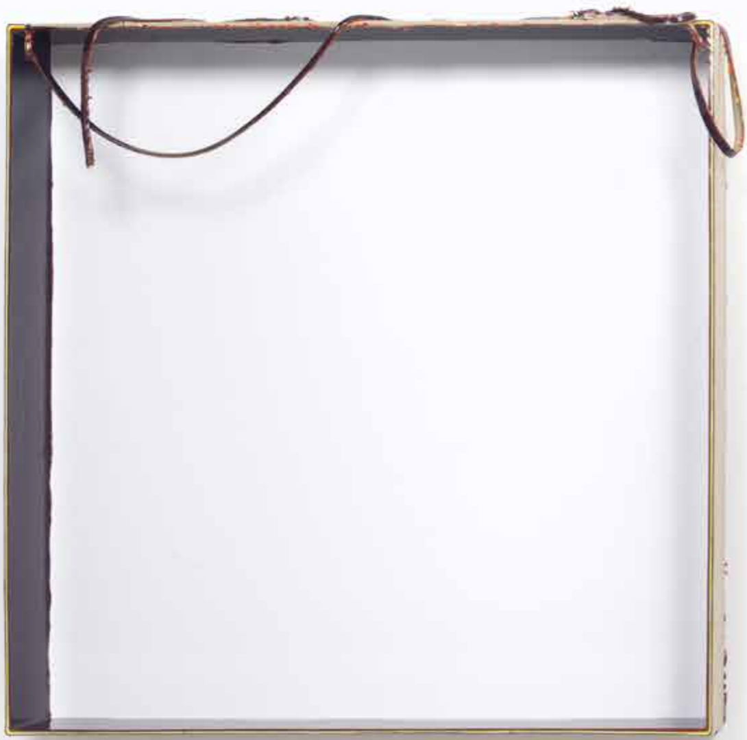
COLOR IS LUST (VIOLET) , 2018 - 2019, acrílico sobre lienzo y acero, 116 x 116 x 17 cm