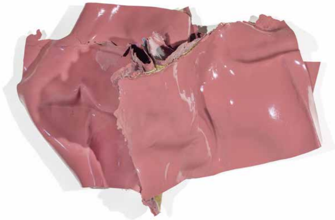
ANGE N° 28 (ROSE) , 2019, acrílico sobre lienzo, 85 x 120 x 35 cm