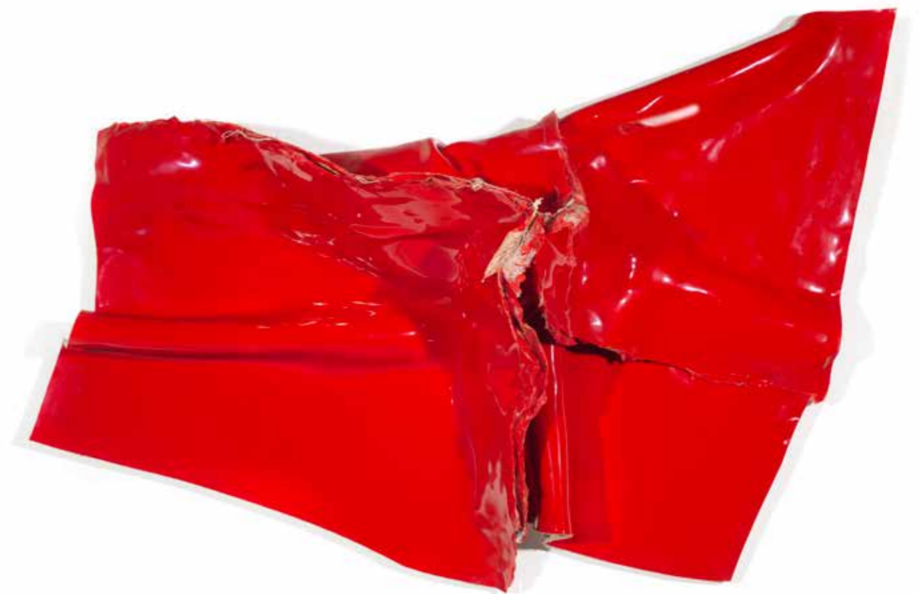
ANGE N° 15 (ROUGE) , 2019, acrílico sobre lienzo, 100 x 115 x 35 cm