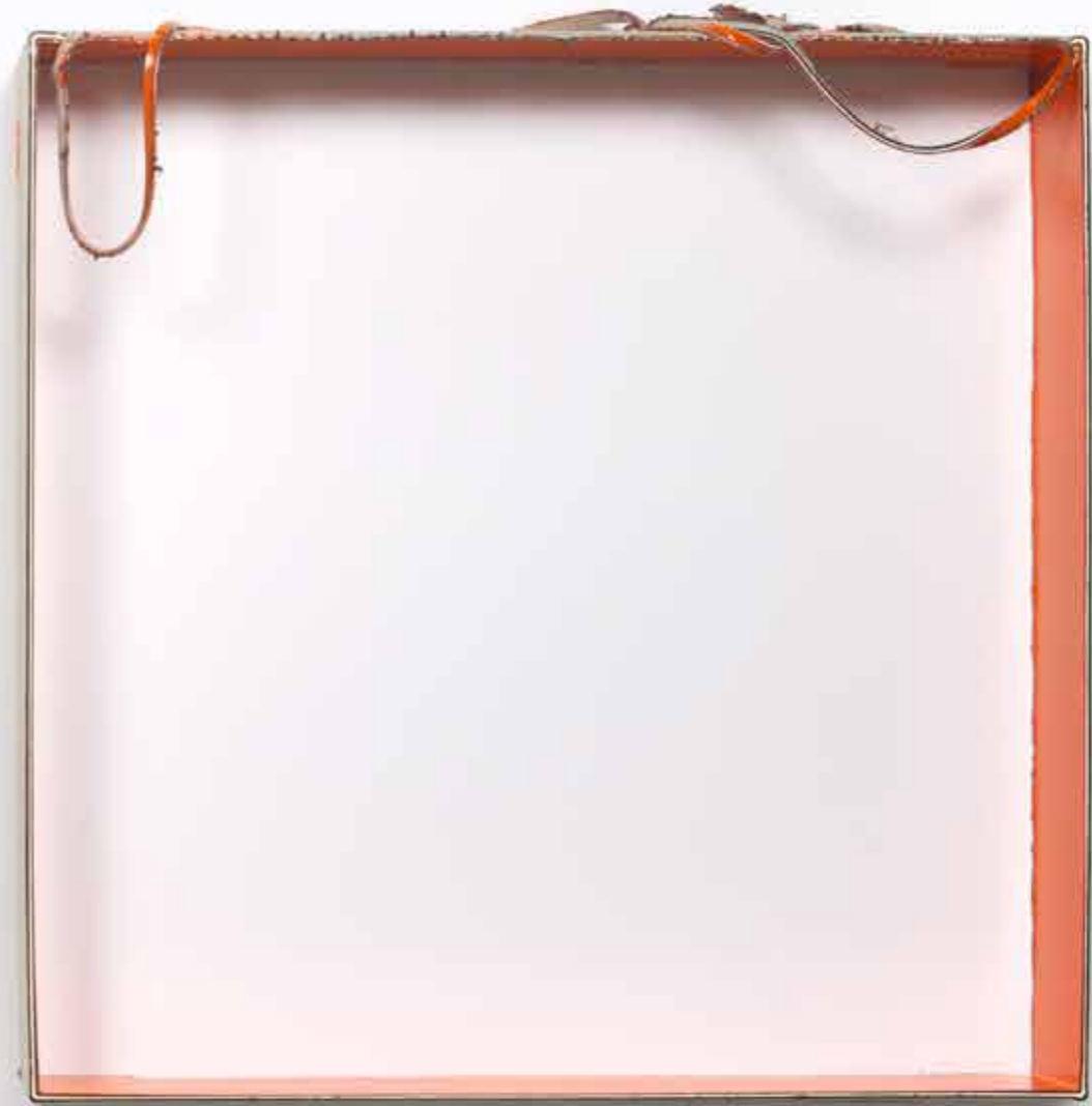
COLOR IS LUST (ORANGE) , 2018 - 2019, acrílico sobre lienzo y acero, 116 x 116 x 17 cm